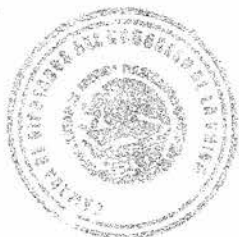
Dip. José de Jesús Zambrano Grijalva Presidente

S A L Ó N DE SESIONES DE LA CÁMARA DE DIPUTADOS DEL HONORABLE CONGRESO DE LA UNIÓN.- México, D.F., a 19 de noviembre de 2015.